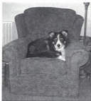
Иллюстрация 14. Удобное место для сна — и мое кресло

будет вовлечено в конфликт с другим животным, как правило, того же самого биологического вида, для того чтобы приобрести или удержать ресурс. У собак, ужасившихся, что угрозы применения агрессии могут служить сохранению или приобретению того, чего они хотят, может развиться ожидание победы в конфликтах за ресурсы. Это не имеет ничего общего со статусом и всецело относится к наиболее ценным для собаки ресурсам и стратегиям, которые она развивает через обучение .