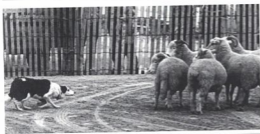
Иллюстрация 4. «Выслеживание» — характерная часть двигательного паттерна бордер-колли

Мозг собаки также претерпел изменения. Собаки больше не думают, как волки, поскольку они не волки. Волки концентрируются в первую очередь на следующих трех вещах: 1) избегании опасностей для того, чтобы не получить ранений и не умереть; 2) охоте для того, чтобы иметь возможность добывать пищу; и 3) размножении, позволяющем передать гены. Ценности собаки отличаются от ценностей волка. К собаочным ценностям относятся то, что она находит вознаграждающим в окружающей ее среде, например, еда, игрушки, прогулки, дружеские отношения, игры с хозяином, аджилити, бросание мяча, игры с палочкой, пастушья работа и все прочее, что мы привнесли в жизнь наших собак.